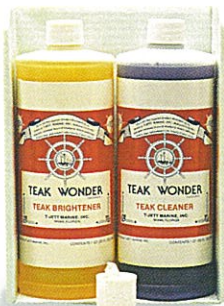
Combo-Pak: Cleaner 0,95 lt. Brightener 0,95 lt.

n'abîment pas les joints de pont, les peintures, les vernis et les pièces d'accastillage en alu ou en inox. L'utilisation du TEAK WONDER BRIGHTENER (Rénovateur) n'est pas toujours obligatoire. Elle a surtout l'intérêt, après le lavage du teck au TEAK WONDER CLEANER (Nettoyant), de raviver le bois.